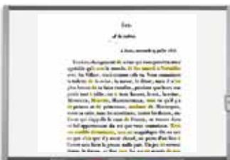
Document 18 : une lettre de madame de Sévigné