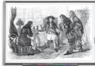
Document 14 : Louis XIV et Molière en 1665