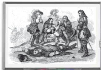
Document 15 : la mort de Turenne (1675)