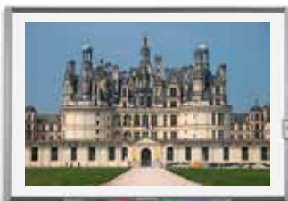
Document 17 : le château de Chambord