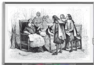
Document 16 : établissement de l'Académie française (1635)