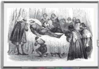
Document 12 : la mort d'Henri IV (1610)