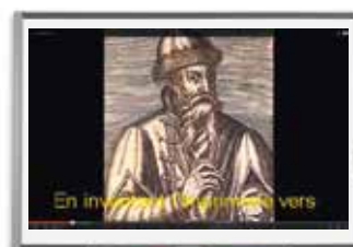
Document 19 : les avancées scientifiques et techniques