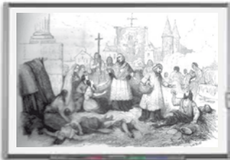
Document 13 : la peste de Marseille (1720)