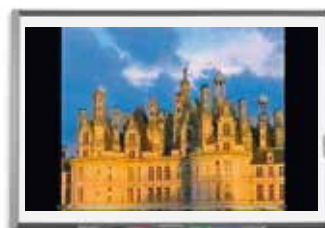
Document 9 : une vidéo