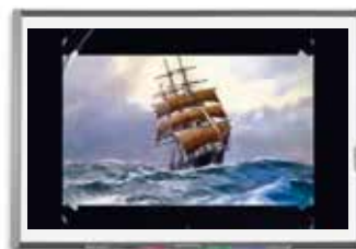
Document 8 : une musique